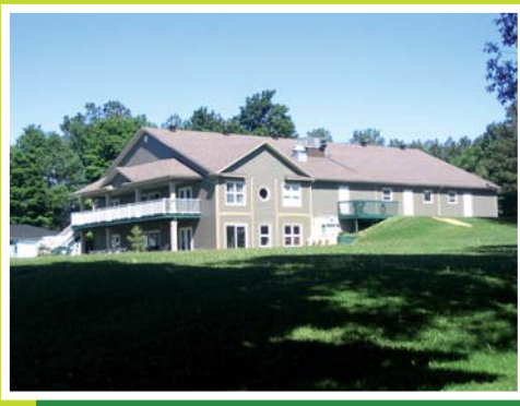
La Villa Maurice Tanguay