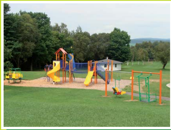
Le Camp «O» Carrefour

Trois partenaires du milieu unissent leurs efforts afin de faire naître un projet de jardin collectif à l'Île d'Orléans. Le Camp «O» Carrefour de Saint-Pierre-de-l'Île-d'Orléans, le Service d'entraide Roc-Amadour et le Centre de santé et de services sociaux de Québec-Nord (CLSC Orléans) collaborent avec d'autres ressources du milieu à la réalisation de ce projet.